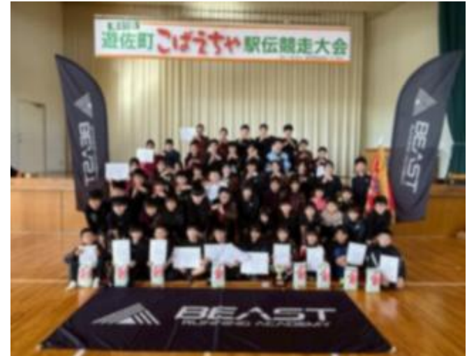
一般社団法人遊佐町総合型クラブ ゆず（遊佐VC（バレーボール））