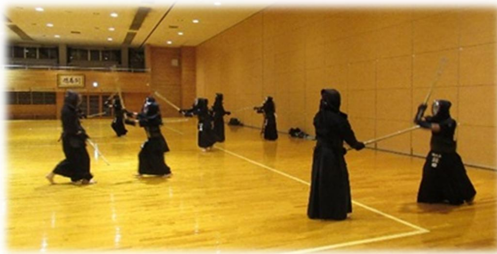
【鶴岡振武会・練習風景①】