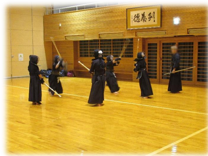
【鶴岡振武会・練習風景②】