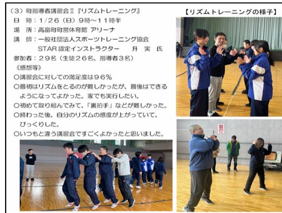
地域クラブ指導者研修会 兼トレーニング講習会(R 7 .1月)