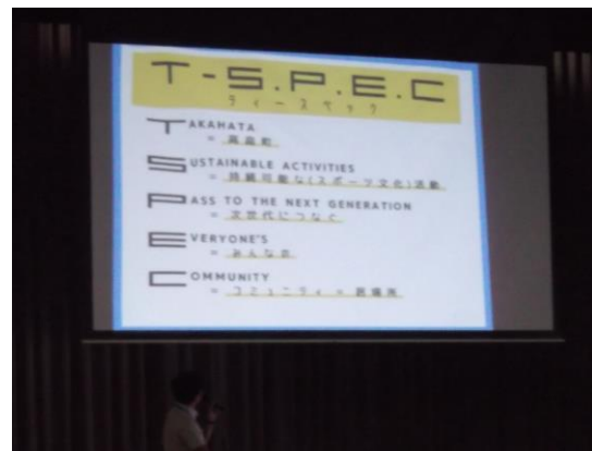
高畠中生への説明会(R 7 .6月)