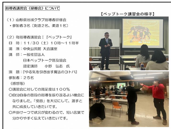
地域クラブ指導者研修会(R 6 .11月)