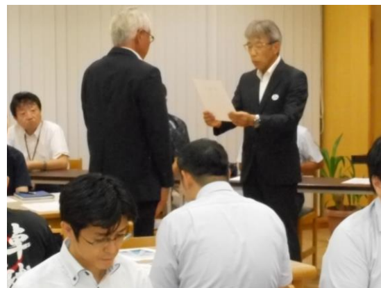
クラブ指導者委嘱式(R 7 .9月)