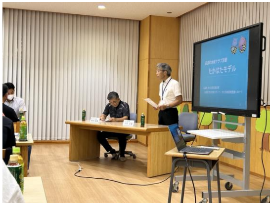
高畠町地域クラブ活動検討委員会(R 6 .9月)