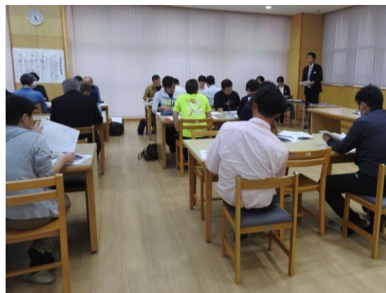
部活動保護者会長・外部コーチへの説明会(R 7 .5月)