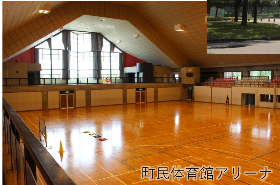
町民体育館アリーナ