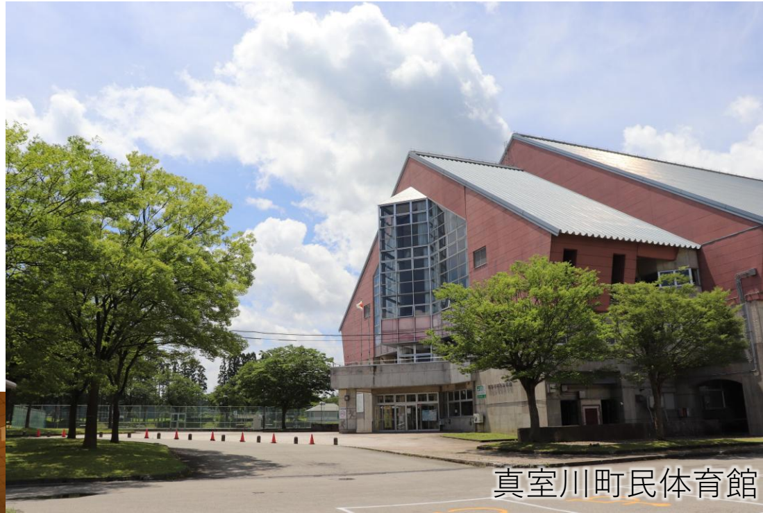
真室川町民体育館