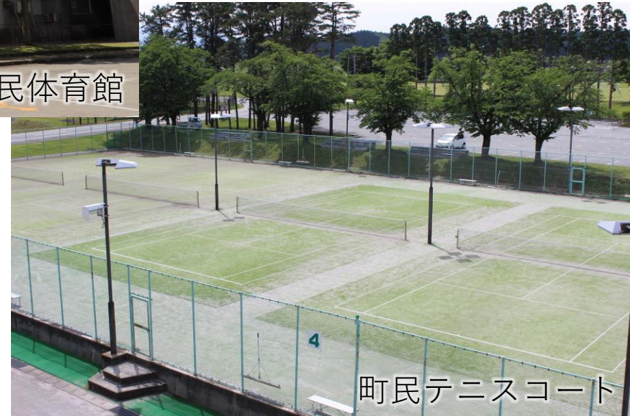
町民テニスコート